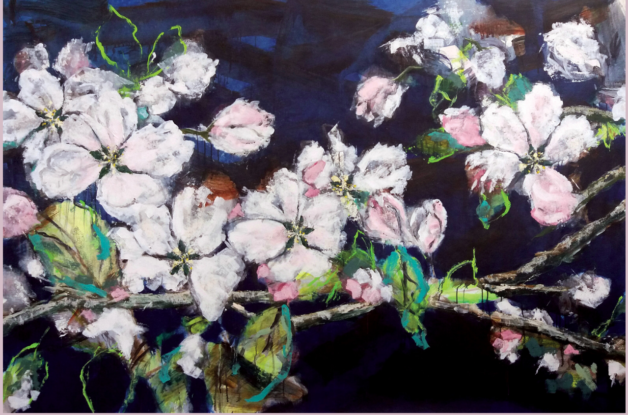
"Æbleblomst i tusindtal", 135 x 200 cm. Akryl på lærred