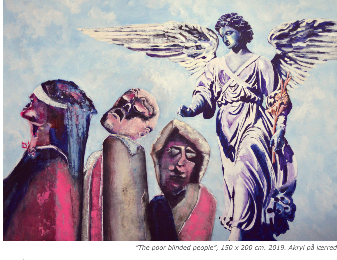
"The poor blinded people", 150 x 200 cm. 2019. Akryl på lærred

Vi har presset os selv så langt ud i civilisationen, at mange mennesker helt har lukket øjnene for fællesskabet, ligheden og kærligheden. Gud og Fanden har vi for længst forladt, og det ypperste, vi tror på, er penge og magt - sig selv og kun sig selv. Denne selv-iscenesættelse er en ensom og mørk vandring, hvor lys og håb er svært at få øje på.